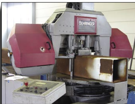
Iso puoliautomaattivannesaha pystyy katkaisemaan kookkaita kappaleita.

Magneettipora Pylväsporakone MK4 ristisyöttöpöydällä Pylväsporakone MK3 Säteisporakone MK5 / 1500 Kärkisorvi Ø700 johteid. päällä / 2500 mm Kärkisorvi Ø380 johteid. päällä / 1000 mm Aarpora TOS W9 Hitsauskoneet 350-500A 6 kpl Pistehitsauskone 400A Korkeapainemaaliruisku 2 kpl Pienkoneet ja käsityökoneet Trukki, nostokyky 2000 kg Pyöräkuormaaja / trukki, nostok. 2500 kg Pyöräkuormaaja / trukki, nostok. 6000 kg Kuorma-auto, kokonaismassa 6000 kg