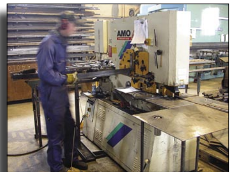
Muotorautaleikkurilla voidaan katkoa tankoterästä edullisesti.