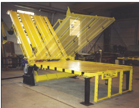
Seinäelementtien osien yhdistäjä.