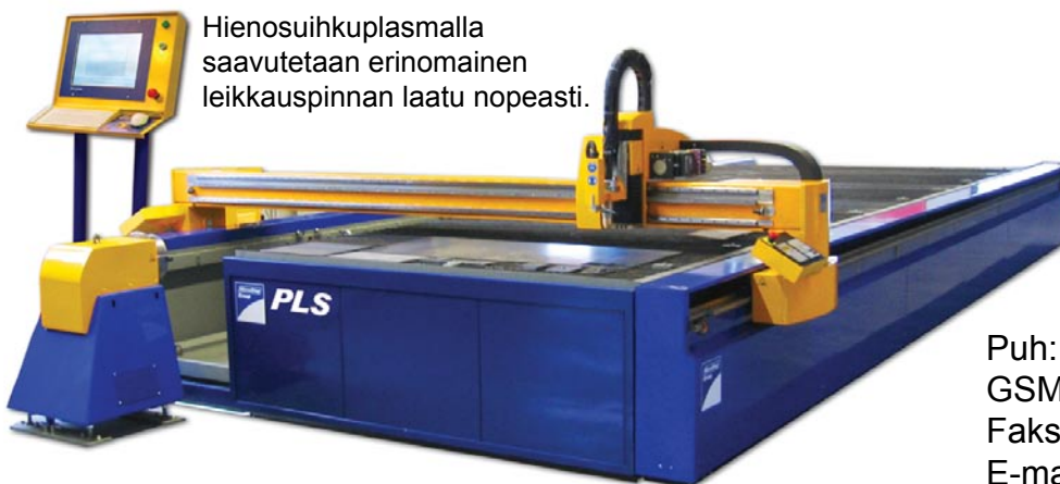
Hienosuihkuplasamalla saavutetaan erinomainen leikkauspinnan laatu nopeasti.